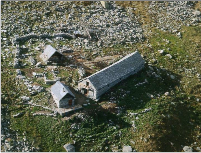
Lo stallone a Cort Zora